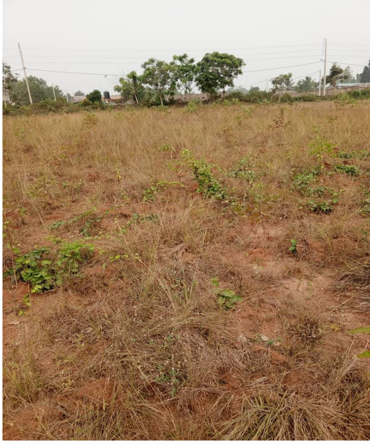
Repousse des mauvaises herbes.