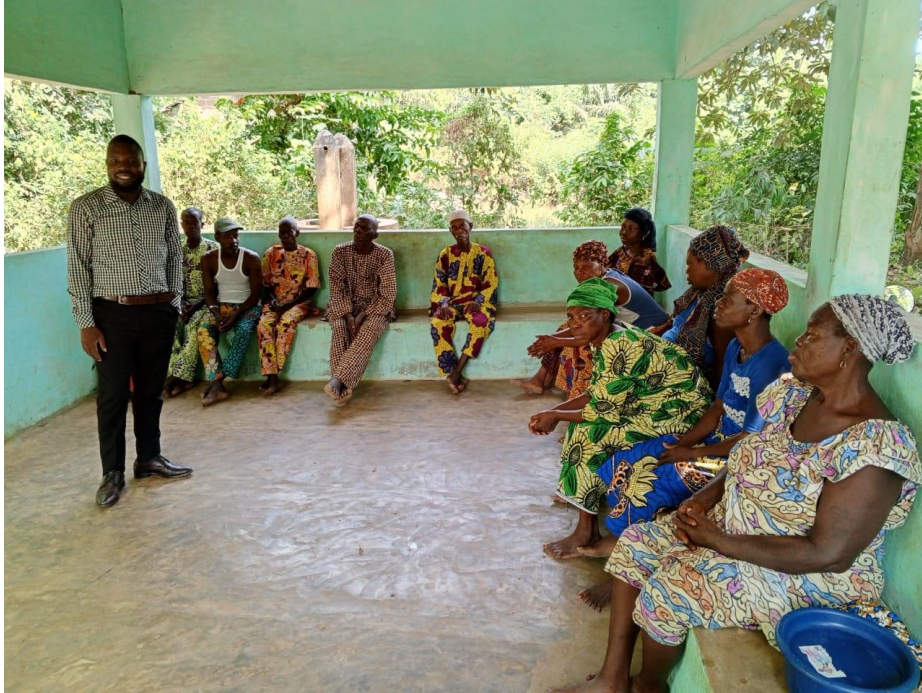
Séance de travail et d'échange notamment autour de la clôture tombée et de la participation de l'ONG