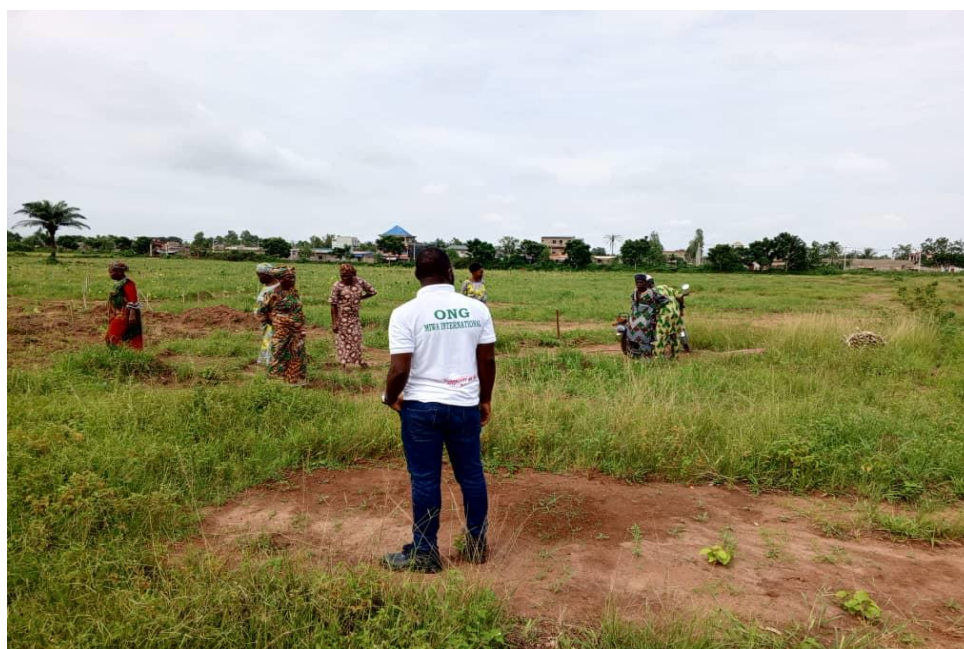
Mobilisation des piquets par les femmes bénéficiaires