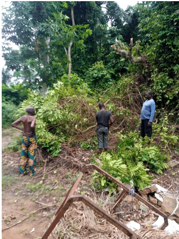
Les bénéficiaires entrain d'ouvrir les voies après la chute de l'arbre et de la clôture