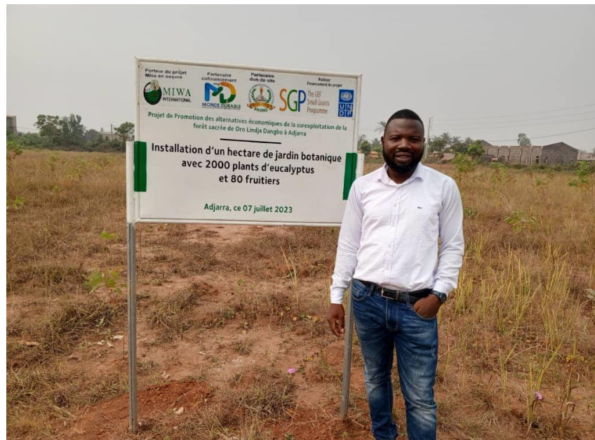
Arrivage et implantation de la plaque à l'université dans le jardin botanique