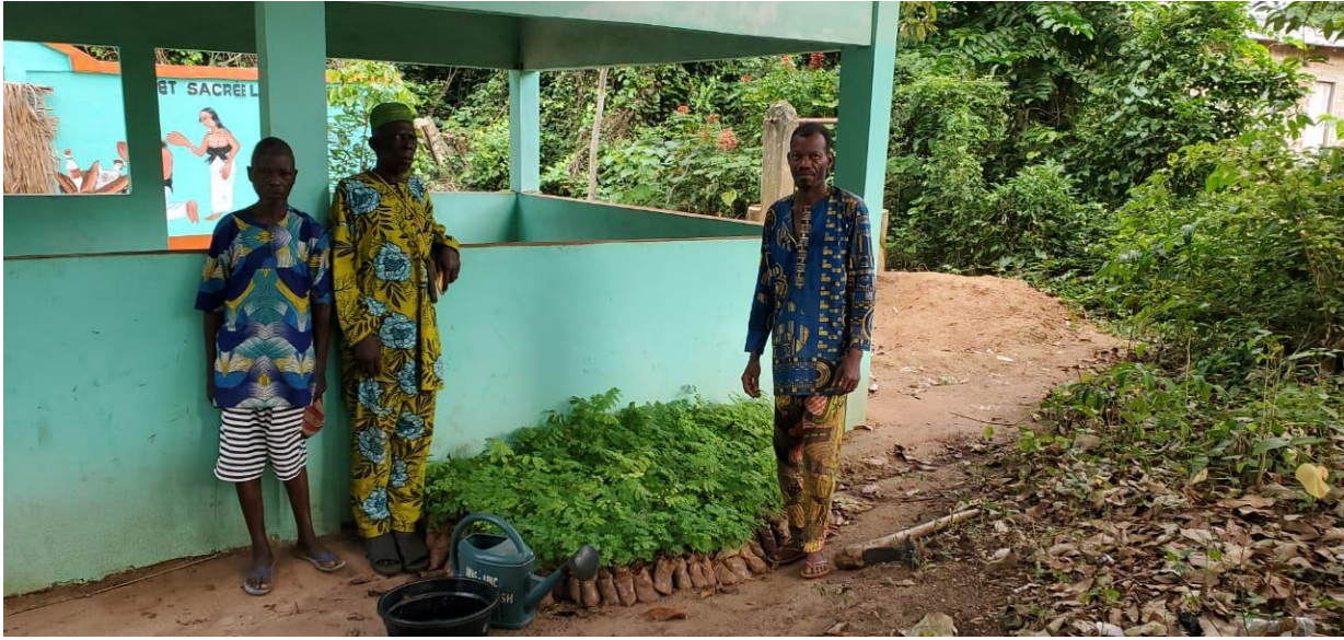
Réception des plants par les bénéficiaires

Les nouveaux plants d'orgueil de chine sont livrés et mis en terre.