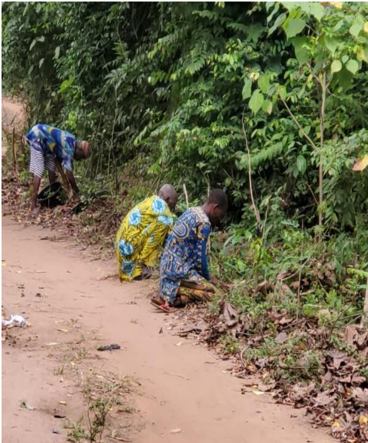
Mise en terre des plants par les bénéficiaires