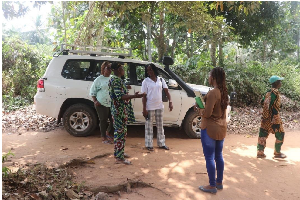
Visite de la communauté par le comité national de pilotage