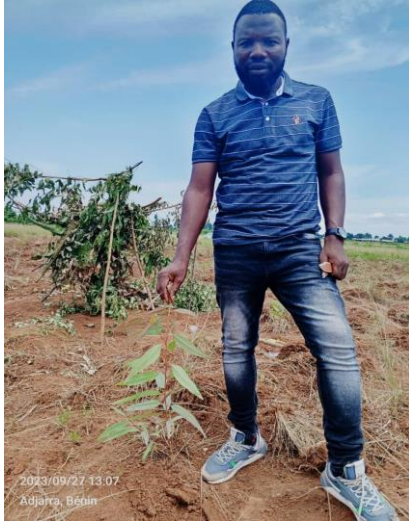
Niveau de croissance des plantes T3