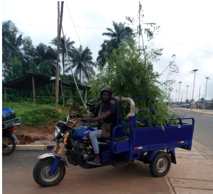
Transport des plants 2 ème voyage

Au cours du trimestre 2 nous avons assuré le transport des plants préalablement réservés et leur mise en terre par les bénéficiaires.