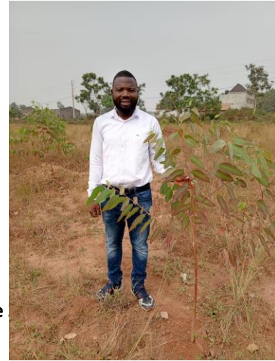
Niveau de croissance des plantes T4

Ce quatrième trimestre a été consacré pour le suivi du reboisement. Il faut reconnaître que la période de sécheresse est vraiment pénible pour les plantes au point que l'ONG a pris la décision d'apporter de l'eau en sachet pure water aux plants. Mais pour le moment, cette option est jugée très onéreuse. Toutefois, si la pluie perdure, c'est l'option qui va être mise en œuvre pour sauvegarder les plants dans le jardin botanique.