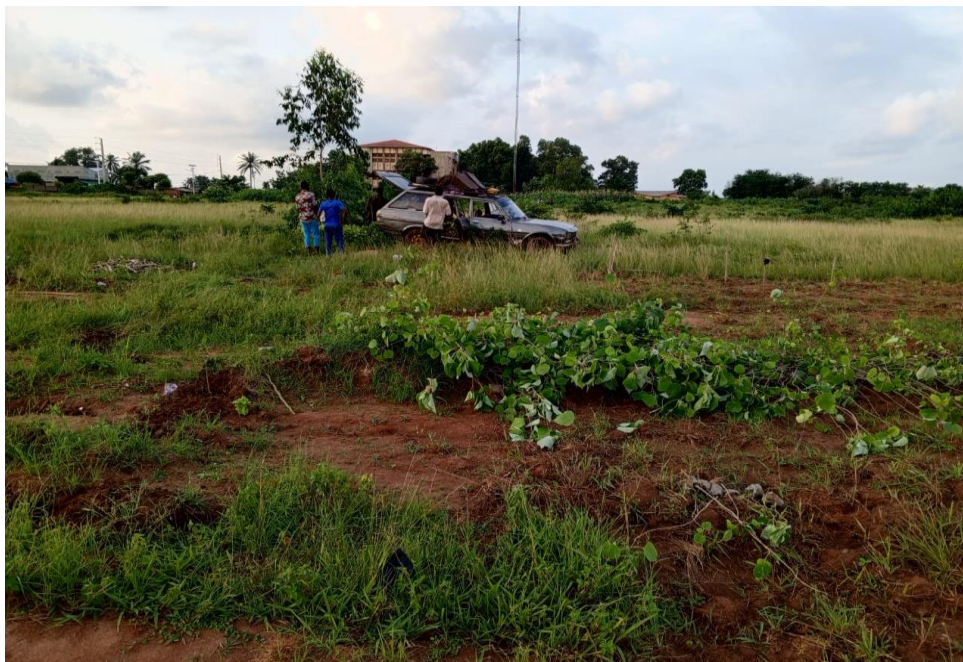
Arrivage des plants à l'université d'Adjarra

Au cours du troisième trimestre de 2023, l'équipe s'est consacrée à l'installation du jardin botanique. Les plantes ont été réceptionnées et mises en terre puis entretenues.