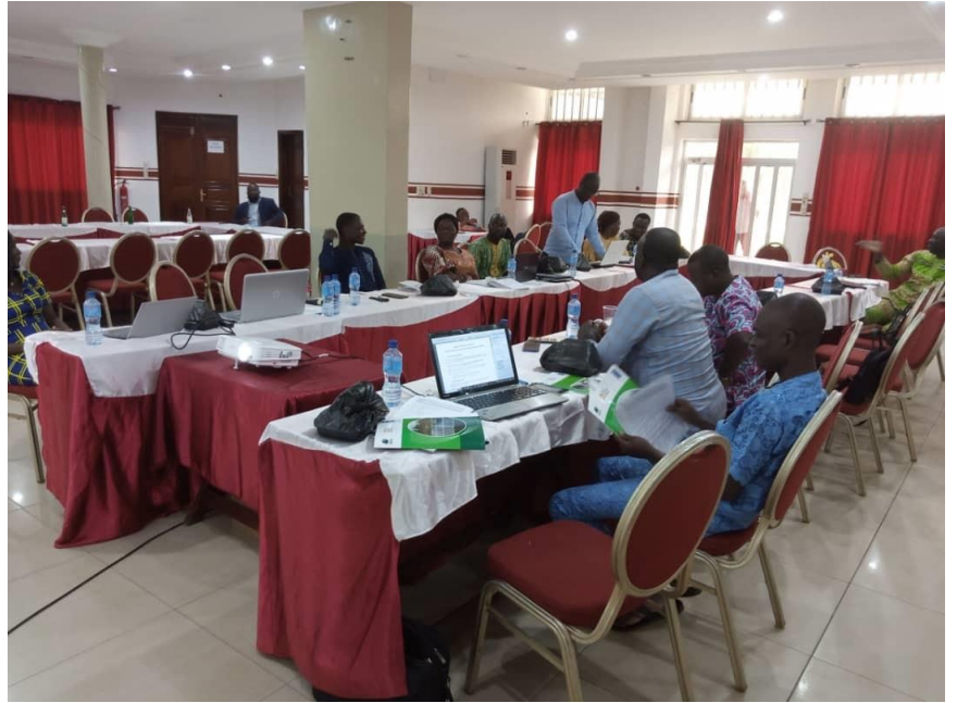
La formation des membres de l'ONG sur les procédures de gestion des fonds alloués