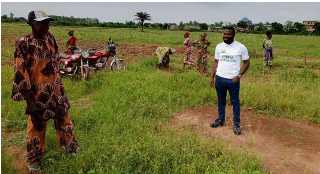
Le responsable des bénéficiaires en échanges avec le président de l'ONG